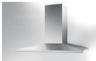
Hotte d'aspiration Amélie 2447 090