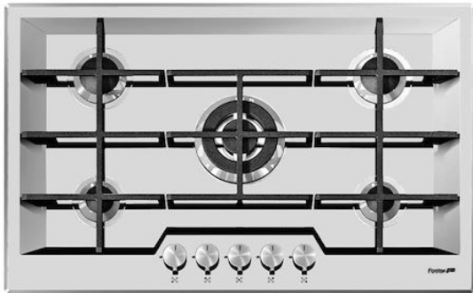
Table de cuisson KE