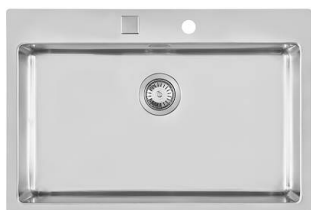
Évier KE Filotop 2266 050